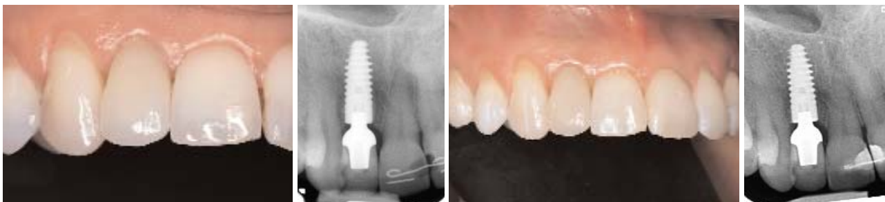
Abb. 21 und 22: Die Situation nach fast einem Jahr (März 2006). – Abb. 23: Klinische Situation ein weiteres Jahr später (Februar 2007). – Abb. 24: Am periimplantären Knochen sind auch fünf Jahre nach der Insertion noch keine Rezessionen erkennbar.