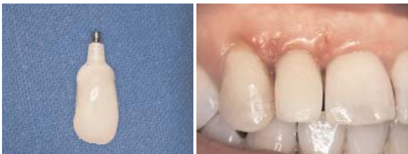
Abb. 10: Die provisorische Krone auf dem individualisierten, definitiven Zirkonaufbau (Ankylos-Cercon-Balance). – Abb. 11: Das Provisorium einen Tag nach der Eingliederung. Die Nähte sind bereits entfernt.