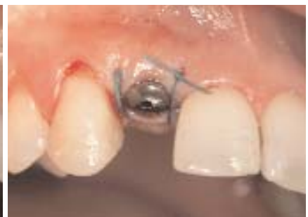
Abb. 6: Schonendes Aufbereiten des Implantatlagers. – Abb. 7: Mit Einzelknopfnahm am Sulcusformer adaptiertes Weichgewebe.