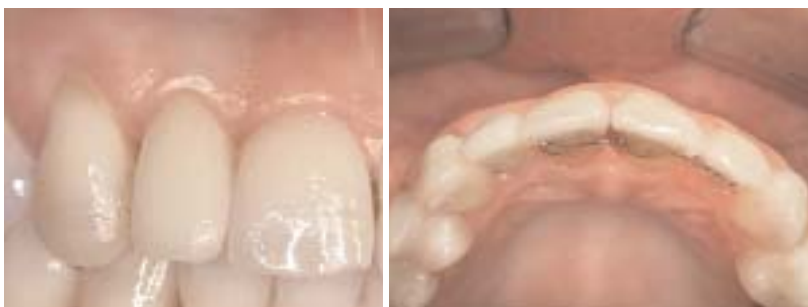
Abb. 12 und 13: Bei der Kontrolle nach drei Monaten zeigt sich eine reizlose und stabile Gingiva.

anatomisch orientierte Form des definitiven Aufbaus, um danach im Labor präoperativ ein passendes Kunststoffprovisorium anfertigen zu können.