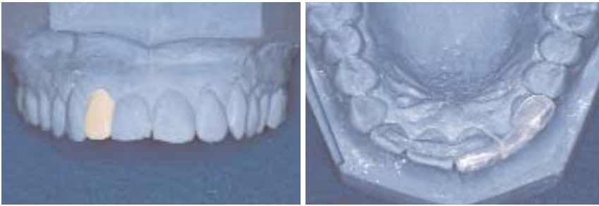
Abb. 4: Das Situationsmodell mit dem Wax-up. – Abb. 5: Die Positionierungshilfe.

plantat und Aufbau bleibt frei von bakterieller Besiedlung. Eine apikal gerichtete Migration des epithelialen Gewebes und der Abbau des periimplantären Knochens werden verhindert. Unter solchen Voraussetzungen kann das Implantat auch subkrestal inseriert werden. Aufgrund der mikrostrukturierten Implantatschulter wächst der Knochen über die Implantatschulter an das Interface zum Abutment. Durch den Erhalt des interdentalen Septums sind die Grundlagen für eine dauerhafte, knöcherne Abstützung der Gingiva und ein natürliches Emergenzprofil gelegt.