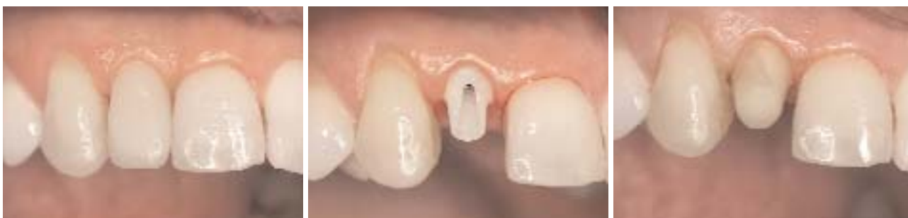
Abb. 14: Die klinische Situation nach fünf Monaten vor der Anfertigung der definitiven Krone. – Abb. 15: Zustand nach Entfernen des Provisoriums. – Abb. 16: Die Kappe aus Vollkeramik wurde bereits Monate zuvor zusammen mit dem individualisierten Aufbau angefertigt. Sie wird für die Abformung provisorisch befestigt.

Implantats wurde mit einer postoperativen Kontrollaufnahme überprüft (Abb. 8). Die krestale Situation erlaubte, wie geplant, die provisorische Sofortversorgung. Nachdem die Naht gelegt war, wurde daher der Sulkusformer wieder entfernt und ein Übertragungsaufbau eingebracht (Abb. 9). Die Abformung erfolgte mit einem individuellen, offenen Löffel. Danach wurde der Sulkusformer wieder eingesetzt. Die Patientin verließ an diesem Tag die Praxis ohne ein Provisorium.