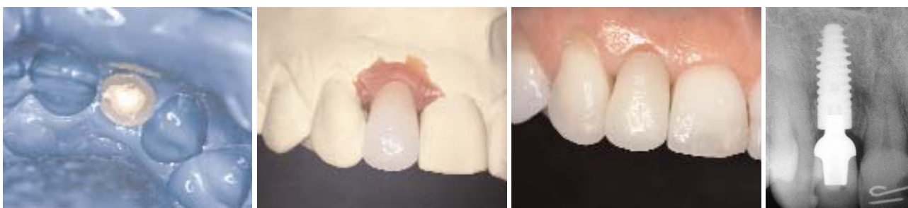
Abb. 17: Die Abformung (Impregum) mit dem Käppchen. – Abb. 18 und 19: Die Keramikkrone auf dem Meistermodell und im Mund (Zahntechnikermeister Martin Zang, Goldbach). – Abb. 20: Das Kontrollbild der definitiven Versorgung zeigt sehr gut die exzellente Anlagerung des Knochens. Der Periotestwert betrug –4.