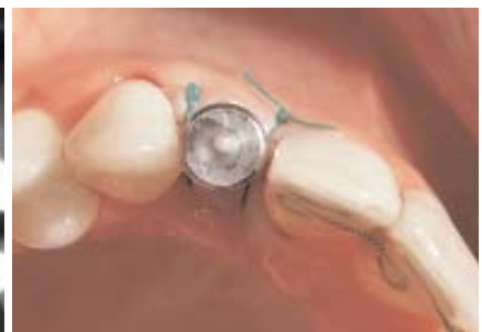
Abb. 8: Situation unmittelbar nach der Insertion. – Abb. 9: Die Ausrichtung des Implantats ist am Übertragungsaufbau erkennbar.